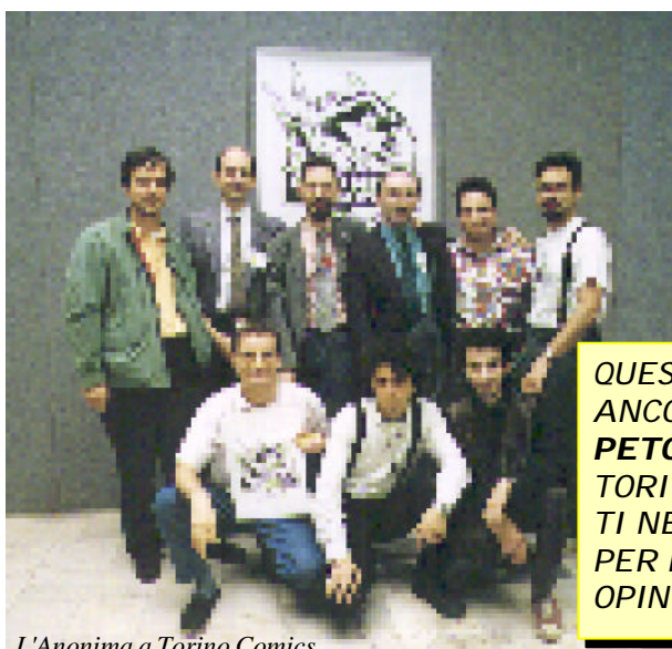
L'Anonima a Torino Comics...

QUESTO NOTIZIARIO VIENE ANCORA INVIATO A TAPPETO A TUTTI GLI OPERATORI DEL SETTORE INSERITI NEL NOSTRO ARCHIVIO, PER FAR CIRCOLARE IDEE, OPINIONI, NOTIZIE ETC.