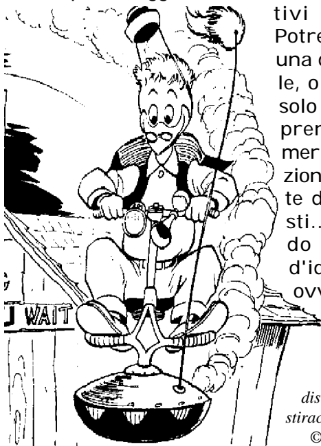
disegno di Carl Barks stiracchiato al computer... © Walt Disney co.

Un mondo narrativo con un simile "mostro" è destinato a sparire per naturale dissoluzione dei motivi avventurosi? Potrebbe sembrare una domanda inutile, o magari adatta solo ad autori apprendisti, invece, merita molta attenzione anche da parte dei professionisti... specie quando si è in crisi d'idee (cosa che, ovviamente, può capitare).